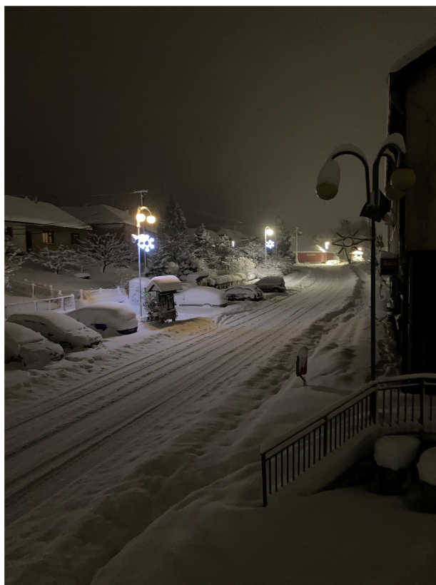
Sněhová nadílka 23.12.2023