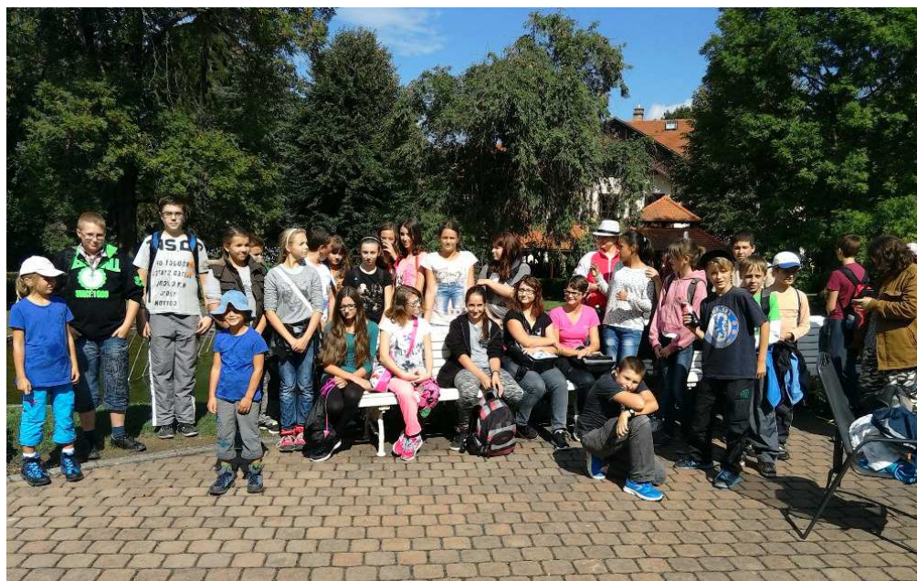
žáci 7. a 8. ročníku

Za zmínku také stojí expozice rejnoků, která je v ZOO v letošním roce velmi populární novinkou. Po umytí rukou a dodržení všech předepsaných pravidel, jsme mohli rejnoky hladit a zakoupeným krmivem i krmit.